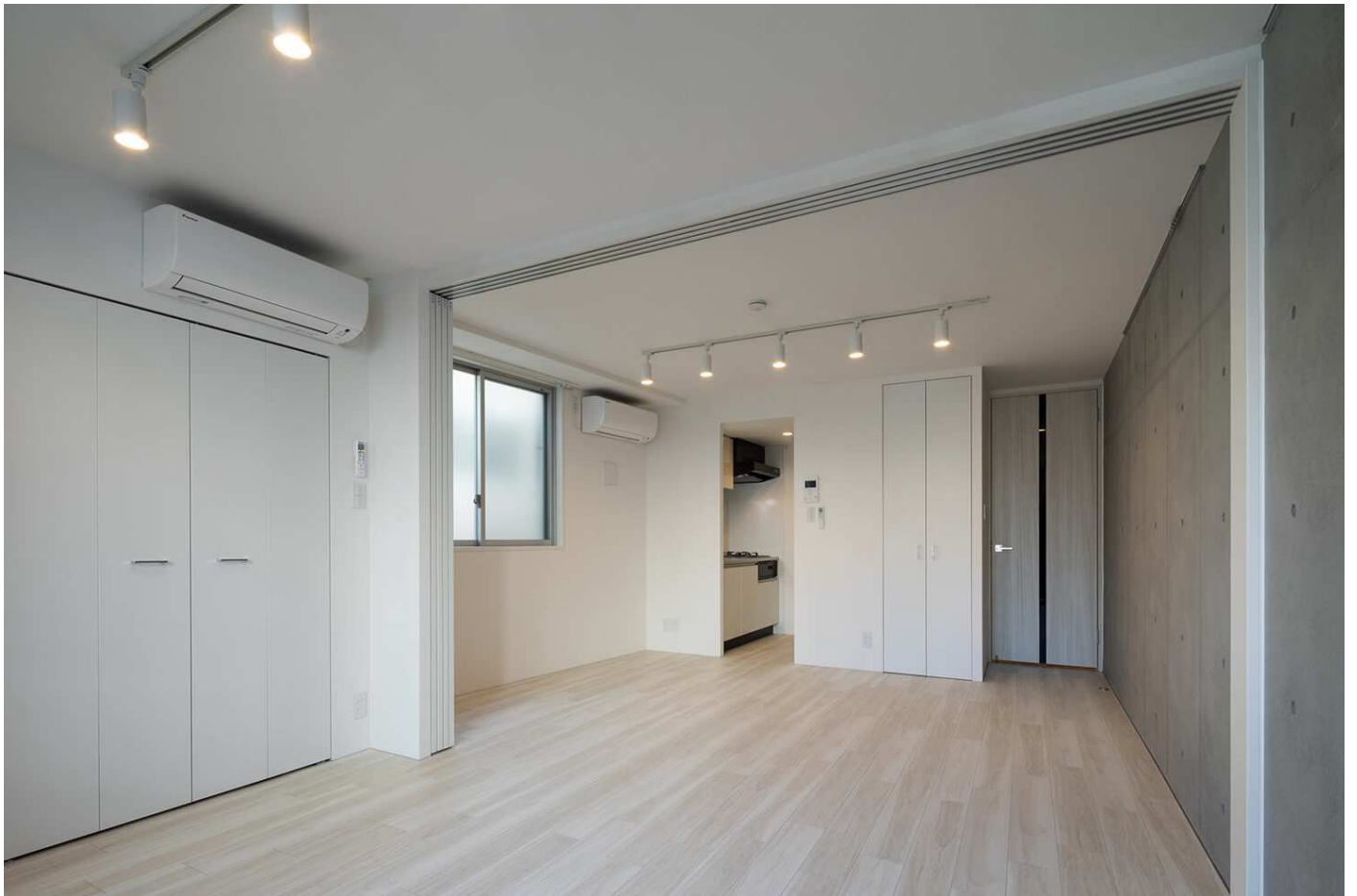
< Branche 阿佐ヶ谷 物件写真 >