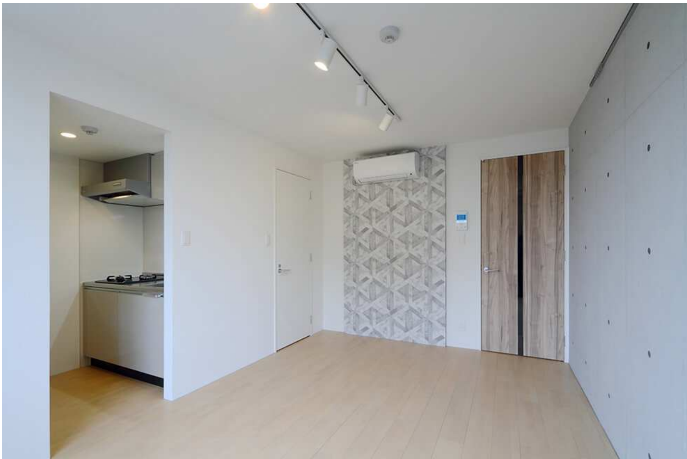
< Branche 桜山Ⅲ 物件写真 >