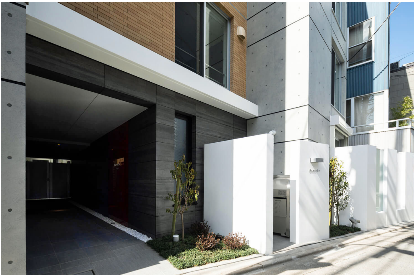
(Branche 阿佐ヶ谷エントランス)

※出資には、事前の会員登録および出資者情報登録が必要となり、お申し込みは先着方式となっております。